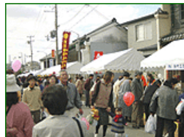
両端には約 50 店の露店が並び

プログラムは出来るだけ簡素化したかったのですが、結局、今迄どおり午前 10 時 30 分より、午後 16 時 40 分迄開催することとなりました。3 つの事前委員長会議は午前中に終了しますが、今回、11 月 14 日は黒江漆器まつり等となっており、特に今年は、海南市政施行 70 周年を記念して、漆器まつり、家具