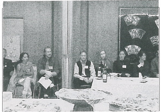
ゲストの外国人の方々