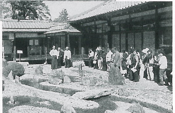
家族旅行スナッフ