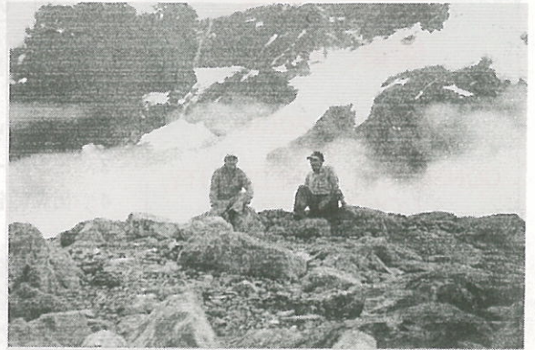
トレッキング風景

是非一度トレッキング行かれることをお勧めします。森と湖、素晴らしい滝、谷間の向こうに雪を頂く高峰、珍しい鳥や花、大自然を充分に満喫出来ます。