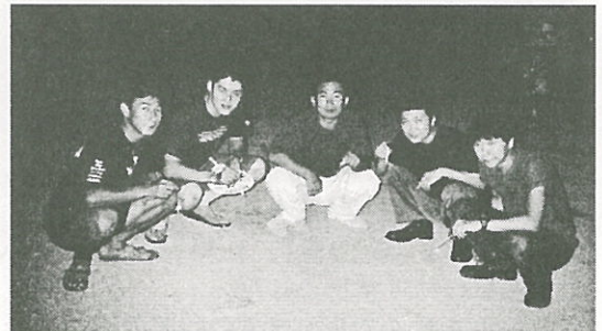
▲第二例会 合同花火大会