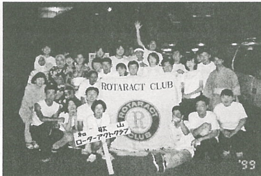
▲第一例会 ぶんだら祭り

第二例会 担当 国際奉仕委員会 H11.8.20(土) 参加者 4名他1名 場 所 和歌山せせらぎ公園