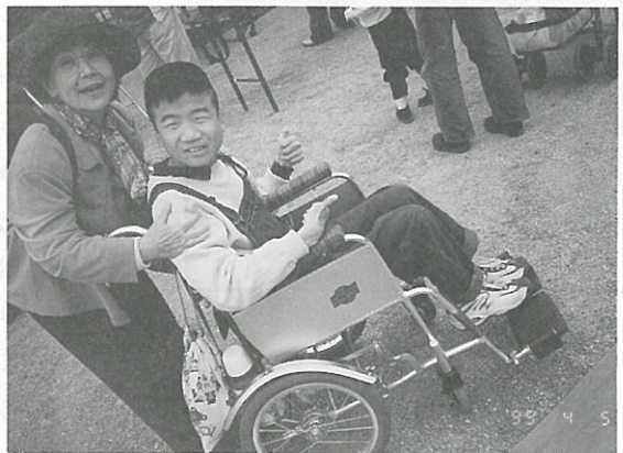
「たんぼぼの会」の子供の