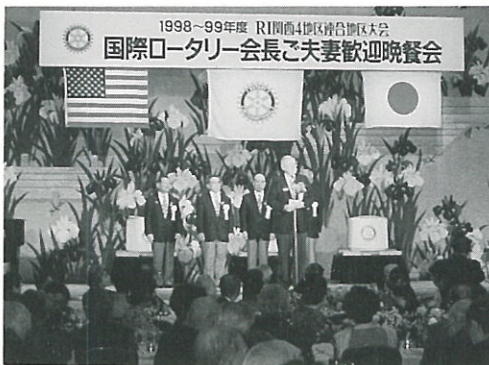
R I 会長夫妻 歓迎晩餐会