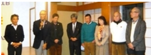
次年度の役員予定者の皆さん「よろしくお願いします」